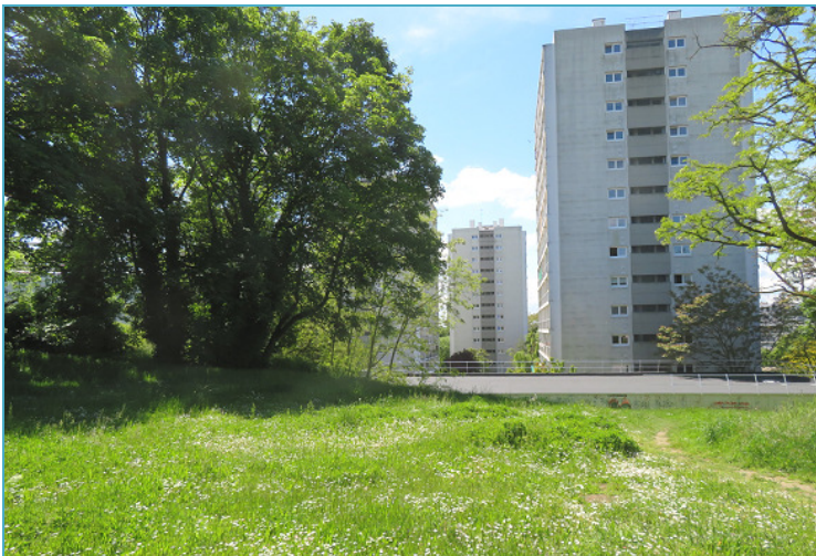
Sorrières : 2000 m 2 d'espaces verts promis au béton par le maire-conseiller départemental sortant de Fontenay-aux-Roses