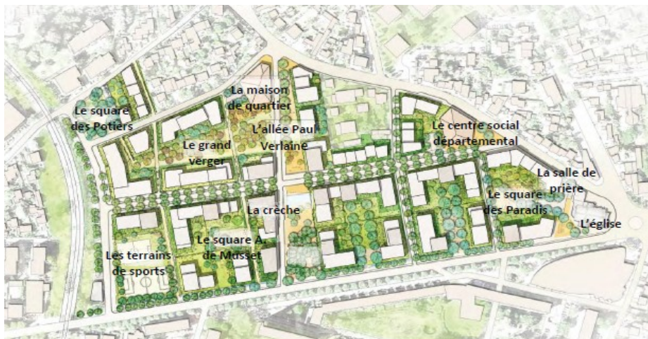
Figure 1: Plan de masse du projet et localisation des espaces publics partagés de la ZAC p.20

Le projet vise à créer un quartier à vocation d'habitation, plus ouvert sur la ville, avec une offre de logement diversifiée et offrant un meilleur cadre de vie aux habitants, notamment en valorisant les espaces publics. Le projet prévoit notamment, après démolition complète des bâtiments existants, la reconstruction de 795 logements sociaux 2 et la construction de 655 nouveaux logements, développant une surface plancher totale de 97 750 m 2 , ainsi que la réalisation ou la restructuration d'équipements publics (crèche, maison de quartier, antenne jeunesse accueillant une salle de boxe) pour un total de surface de plancher de 2 000 m 2 .