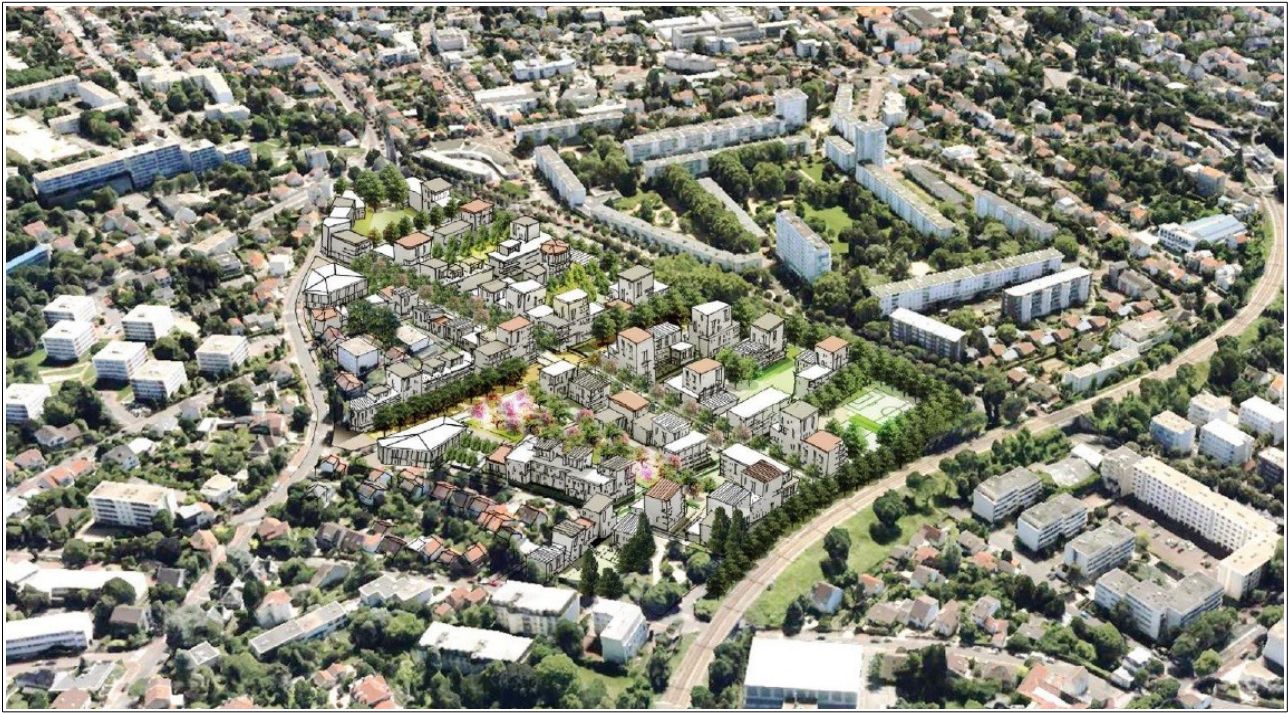
Fig. 3 : esquisse du projet retenu

L'étude d'impact indique à plusieurs reprises que « la topographie du site va être complètement modifiée ». Or le sens de cette proposition est confus, puisqu'elle semble recouvrir à la fois le nivellement des espaces publics et l'épannelage des constructions. Par exemple, la création de la promenade Verlaine, espace public central et traversant, est susceptible d'ouvrir une percée visuelle vers le sud en contrebas. D'autre part, des bâtiments plus hauts sont prévus sur la partie sud, où le niveau du terrain est le plus bas, pour « atténuer l'impact des hauteurs des bâtiments » (page 58). Aucun visuel ne permet d'apprécier précisément ces impacts à l'échelle du site et, a fortiori , de démontrer en quoi les terrassements et constructions sont susceptibles de diminuer l'enclavement du site au regard de la topographie actuelle.