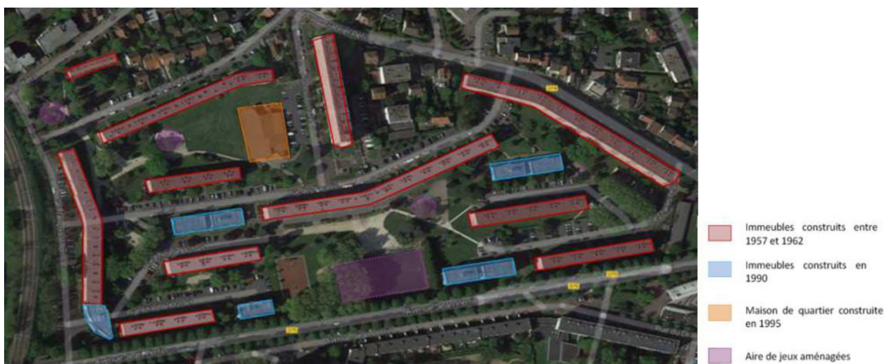
Fig. 1 : Typologie actuelle du bâti

Le site, d'une superficie de 8 ha, s'inscrit dans un vallon dû au creusement du terrain par la Bièvre 2 . D'après l'étude d'impact, le quartier des Paradis tient son nom de la variété de pommiers historiquement cultivée sur le secteur. Il est marqué par les grands ensembles des Blagis, construits à la fin des années 1950 sur les communes de Fontenay-aux-Roses, Bagneux, Sceaux et Bourg-la-Reine. Dans les années 1990, ces immeubles sont rénovés et de nouvelles constructions sont réalisées. Une maison de quartier (en marron sur la figure 1) et une aire de jeux, ( en violet sur la figure 1) complètent la structuration de l'îlot. Actuellement, le quartier est délimité par le talus du RER B à l'ouest, les avenues Jean Perrin – RD 75 et Gabriel Péri – RD 74, respectivement au sud et au nord-est, le carrefour giratoire des Blagis à l'est et une frange d'habitations pavillonnaire relativement dense au nord. (cf fig.1)